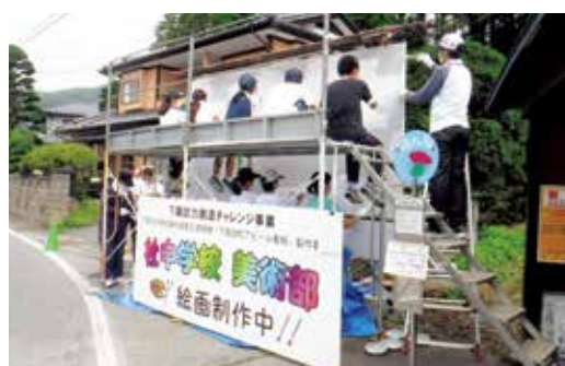
チャレンジ事業(下諏訪町アピール看板)