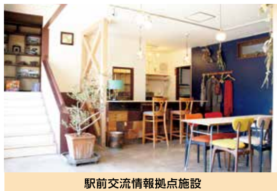
駅前交流情報拠点施設

また、移住から定住に向けてのフォロー体制を構築することにより、県内・県外の他地域に負けない、移住先として「選ばれるまち」となるよう、重点的に取り組みます。