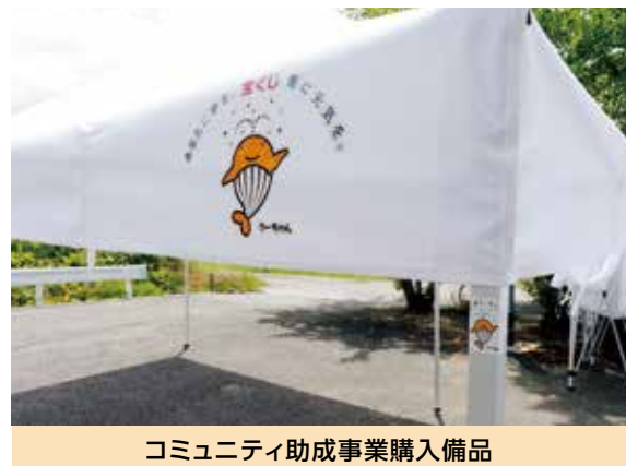
コミュニティ助成事業購入備品

子どもたちが小さいうちから地域社会と関わりを持って成長できるよう、体験・体感の場を増やすとともに、若い人たちが地域活動で力を発揮できるよう、地域コミュニティへの参加機会の拡大をめざします。