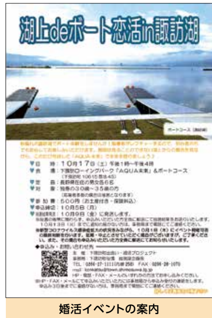
婚活イベントの案内

また、年少期から家庭の幸せを実感し、家庭を築くことへの憧れを育む教育や啓発などを進めることが重要です。